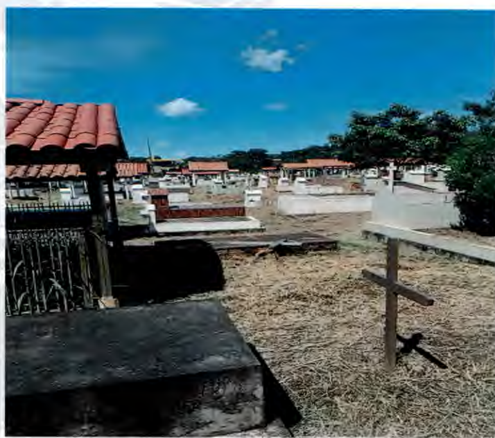
Imagem 03 e 04. Espaço físico do Cemitério Jardim da Saudade, após a conclusão dos serviços de limpeza.