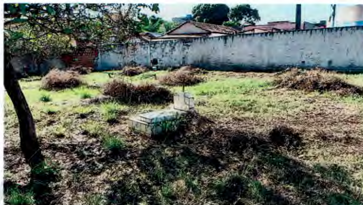
Imagem 01 e 02. Espaço físico do Cemitério Jardim Eterno, após a conclusão dos serviços de roço.