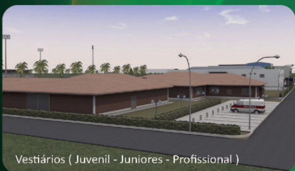
Vestiários ( Juvenil - Juniores - Profissional )

O Centro de Treinamento será construído na PA - 160, numa área de 100.000m 2 , envolvendo toda estrutura necessária de um clube de grande porte. Terá espaço para acolher os atletas com moradia e refeitório, sala de computadores e salão de jogos.