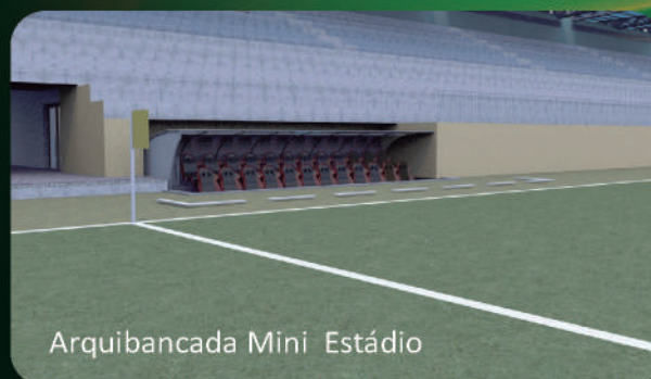
Arquibancada Mini Estádio