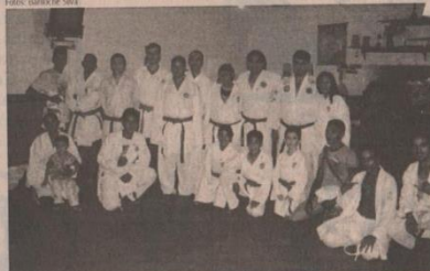
Alunos estão satisfeitos com a doação