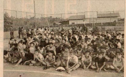
Oitenta crianças e adolescentes estão sendo beneficiadas com o projeto