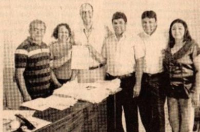
O convênio entre o Comdcap e a Associação Girão de Karatê vai beneficiar 80 crianças

25.000,00 (vinte e cinco mil reais) para atender oitenta crianças na comunidade da Vila Sansão e a Associação vai atender essas 80 crianças com aulas de karatê, palestras educativas sobre AIDS, meio ambiente, violência na juventude e vários outros tipos de palestras que visam tirar as crianças da ociosidade para torná-las multinificadoras"