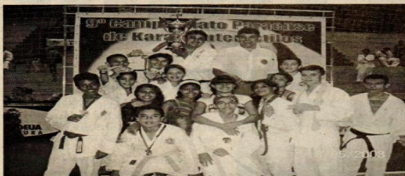
Equipe recebendo troféu de Vice campeão geral do paraense 2008