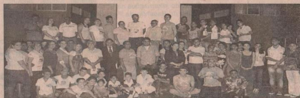
Alguns dos participantes do evento

termina a lei, mas lamenta a ausência de órgãos importantes e responsáveis pela fiscalização dos recursos, que não estiverem presente. O Conselho Municipal dos Direitos da Criança e do Adolescente de Parauapebas trabalha para promover, qualificar e garantir os direitos, de acordo com o Estatuto da Criança e do Adolescente, pensando em uma sociedade mais justa para os jovens de Parauapebas. (Dei-charias Damascena)