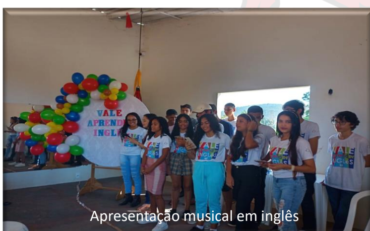
Apresentação musical em inglês