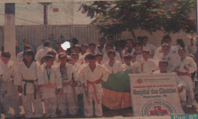
Delegação de Caratecas vitoriosos de Parauapebas