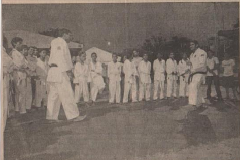
Jovens no dia mundial de combate a Aids em Parauapebas

No último sábado (1º) foi comemorado o dia mundial da luta contra a AIDS. Em Parauapebas, a Secretaria Municipal da Mulher e o Grupo de apoio às pessoas vivendo com HIV+ (GAPP+), participaram do dia focando o tema no público jovem para uma geração sem AIDS, a programação iniciou-se às 15 horas na Praça de Eventos do bairro Cidade Nova.