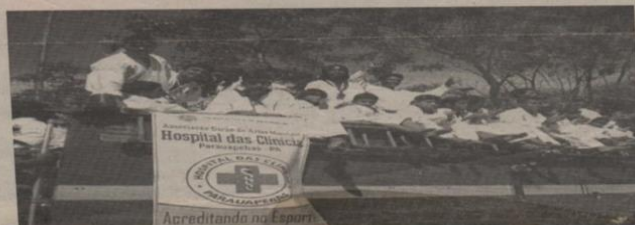
Karatecas conquistaram 48 medalhas

sificação geral da competição. O curioso é que das 64 medalhas que o Pará conquistou no torneio 46 foram ganhas por atletas da nossa cidade. Isto prova que Parauapebas não está bem representada só no futebol, mas em outras modalidades também! É o que provou a equipe de Karatê. Parabéns a todos os atletas que competiram, a todos os envolvidos direto ou indiretamente. São os sinceros votos da equipe de esporte do Carajás o Jornal.