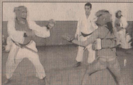
Alunos se dedicam ao máximo nos treinos. Expectativa de medalhas