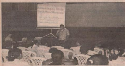
Associação Girão mostrando onde foram feitos os investimentos

Com a finalidade de esclarecer com transparência e apresentar à sociedade em geral as aplicações e a utilização dos recursos do Fundo Municipal dos Direitos da Criança e do Adolescente de Parauapebas (Fumdcap), o Conselho Municipal dos Direitos da Criança e do Adolescente de Parauapebas (Comdcap) realizou na última quarta-feira (25) a prestação de contas dos recursos usados pelo Comdcap e dos convênios realizados.