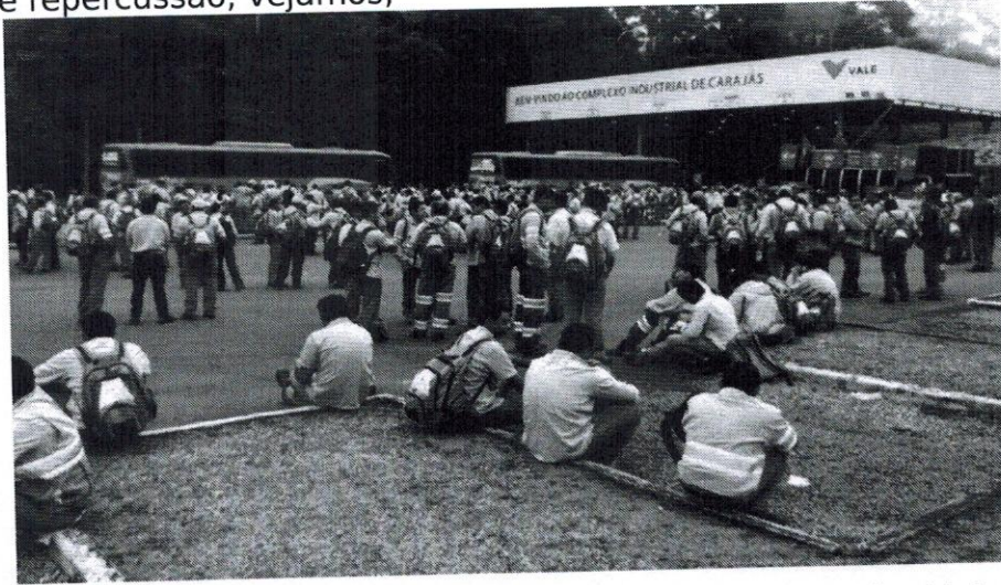
Infecção por Covid-19 explode entre trabalhadores da Vale no Pará e cidade entra em colapso

A contaminação entre funcionários Vale e colapso na saúde gerou enorme repercussão, vejamos;